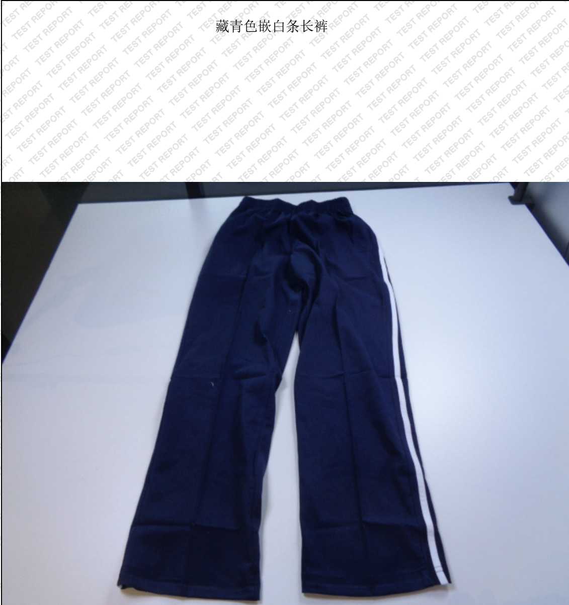
藏青色嵌白条长裤